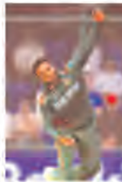
बांग्लादेश ने अभी तक टी20 विश्व कप टीम का खुलासा नहीं किया है, लेकिन शाकिब की समय पर वापसी इस बात का संकेत है कि उन्हें शामिल किया जा सकता है।