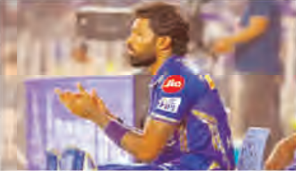
तीन हार के साथ सीजन की शुरुआत की। हालांकि उन्होंने अपने अगले चार मैचों में से तीन जीते, लेकिन चार हार के कारण उनके प्लेऑफ की संभावनाएँ बुरी तरह प्रभावित हुईं। जसप्रीत बुमराह मुंबई के लिए सर्वश्रेष्ठ प्रदर्शन करने वाले खिलाड़ियों में से एक रहे, उन्होंने 12 मैचों के बाद 6.20 की इकॉनमी के साथ 18 विकेट लिए और वह

एजेंसी नई दिल्ली। सनराइजर्स हैदराबाद (एसआरएच) ने लखनऊ सुपर जायंट्स (एलएसजी) को दस विकेट और 10.2 ओवर शेष रहते हरा दिया, जिसके बाद मुंबई इंडियंस आईपीएल 2024 में प्लेऑफ की दौड़ से बाहर होने वाली पहली टीम बन गई। धर्मशाला में रॉयल चैलेंजर्स बंगलुरु से खेलेगी। मुंबई ने अपने नए कप्तान हार्दिक पांड्या के नेतृत्व में लगातार सर्वाधिक विकेट लेने वाले खिलाड़ियों की सूची में शीर्ष पर हैं। हालांकि, टीम के अन्य गेंदबाजों में ही बना पाए हैं। हार्दिक का भी यह सीजन खराब रहा है, उन्होंने 11 पारियों में केवल 198 रन बनाए और 10.58 की इकॉनमी रेट के साथ 11 विकेट लिए। रोमारियो शेफार्ड, मोहम्मद नबी और नुवान तुषार को मौके देने के बावजूद, वे अपने विदेशी खिलाड़ियों से ज़ादा से ज़ादा पायदा नहीं उठा पाए हैं। उनका स्पिन विभाग उनका कमजोर पक्ष रहा और टूर्नामेंट में अब तक उनके 68 कुल विकेटों में से केवल 13 ही लिए हैं। जबकि उन्होंने घर पर अपने छह मैचों में से तीन जीते, उन्हें बाहर का समय कठिन लगा, पांच में से उनकी एकमात्र जीत पंजाब किंग्स के खिलाफ मिली। उनके शुरुआती एलिमिनेशन का मतलब है कि मुंबई का अपने छठे आईपीएल खिताब का इंतजार जारी है, जिसने 2019 और 2020 में अपना चौथा और पाँचवां खिताब जीता है। तब से, उन्होंने चार सीजन में केवल एक बार प्लेऑफ में जगह बनाई है, वह भी 2023 में। वहां भी उन्हें क्वालीफायर 2 में गुजरना टाइटन्स ने बाहर कर दिया था।