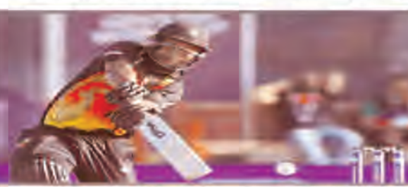
के लिए अब बहुत ज़ादा प्रशिक्षण के साथ एक अलग एहसास है, क्योंकि पिछली बार कोविड के दौरान प्रशिक्षण हुआ था और तैयारी उतनी अच्छी नहीं थी, जितनी कि हम अभी कर रहे हैं। मैं इस आयोजन का बेसब्री से इंतजार कर रहा हूँ, क्योंकि मुझे पता है कि हम

नई दिल्ली। पापुआ न्यू गिनी ने आईसीसी पुरुष टी 20 विश्व कप के लिए अपनी 15 सदस्यीय टीम की घोषणा कर दी है। यह इस टूर्नामेंट में पापुआ न्यू गिनी की दूसरी उपस्थिति होगी। टीम को टूर्नामेंट में रण सी में रखा गया है। टूर्नामेंट के 2021 संस्करण की तरह, असद वाला टीम के नेतृत्व कर रहे हैं, जिन्होंने जुलाई 2023 में पूर्वी एशिया-प्रशांत क्षेत्रीय फाइनल के माध्यम से इस वर्ष की प्रतियोगिता के लिए अपना स्थान पक्का कर लिया है। कप्तान ने स्वीकार किया कि 2021 में कोविड जटिलताओं से निपटने के बाद टीम इस साल के मुक़ाबले के लिए अधिक तैयार है, और इस बार कैरिबियन में उन्हें काफी उम्मीदें हैं। लोग स्पिन ऑलराउंडर सीजे अमिनी टीम के उपकप्तान होंगे। आईसीसी के हवाले से असद ने कहा, टीम के अंदर ऊर्जा बहुत अच्छी है। पिछले टी20 विश्व कप में भाग लेने वाले कुछ खिलाड़ियों