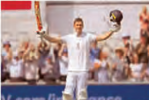
रही थी, इसलिए मैं लाल गेंद पर सबसे ज्यादा ध्यान रखता था और उसी टीम में रहना चाहता था। टेस्ट प्रार्थना खेलना हमेशा मेरी प्राथमिकता रही है। यह हमेशा मेरा

लंदन। इंग्लैंड के टेस्ट सलामी बल्लेबाज जैक क्रॉली को उम्मीद है कि वह सीमित ओवरों की टीम में अधिक निरंतर भूमिका निभाएंगे और उन्हें लगता है कि 50 ओवर और टी 20 प्रारूप उनकी खेल शैली के लिए उपयुक्त है। 2021 में इंग्लैंड के लिए पदार्पण करने के बाद से, क्रॉली ने केवल आठ वनडे खेले हैं, जिसमें उन्होंने 28.42 की औसत से 199 रन बनाए हैं। उन्हें अभी तक टी20 टीम में शामिल नहीं किया गया है। क्रॉली ने स्काई स्पोर्ट्स क्रिकेट पॉडकास्ट से कहा, मैं हमेशा से एक अच्छा सफेद गेंद वाला खिलाड़ी बनना चाहता था। मैं अपने खेल में कुछ अन्य शॉट जोड़ने की कोशिश कर रहा हूँ, लेकिन मुझे लगता है कि यह कामी अनुकूल है और मैंने अतीत में टी20 क्रिकेट में अच्छा प्रदर्शन किया है। पिछले कुछ वर्षों में, चीजें विशेष रूप से अच्छी नहीं चल